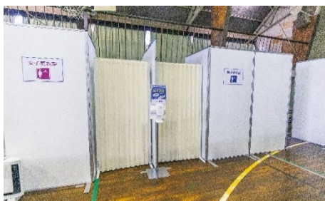
男女別更衣室 (パーティション・手指消毒剤など)