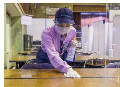
衛生サービス (共有部分の定期的な清掃など)